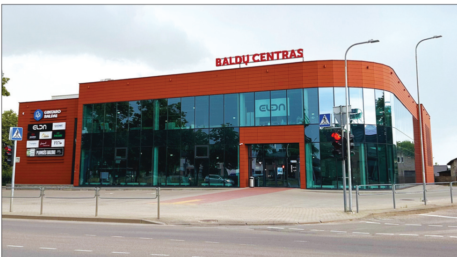
2017 m. pastatytas baldų centras – didžiausias Rytų Lietuvos regione