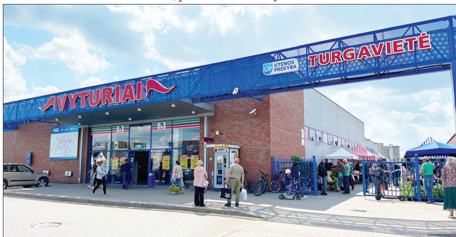
Prekybos centras „Vyturiai“ pastatytas 2005 m., o 2018 m. renovuota miesto turgavietė