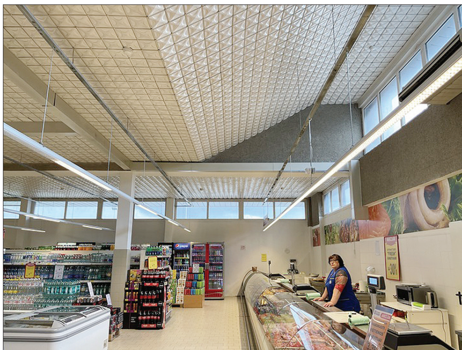
Atliekant prekybos centro „Aukštakalnis“ renovaciją paliktos autentiškos lubos iš glazūruotos keramikos