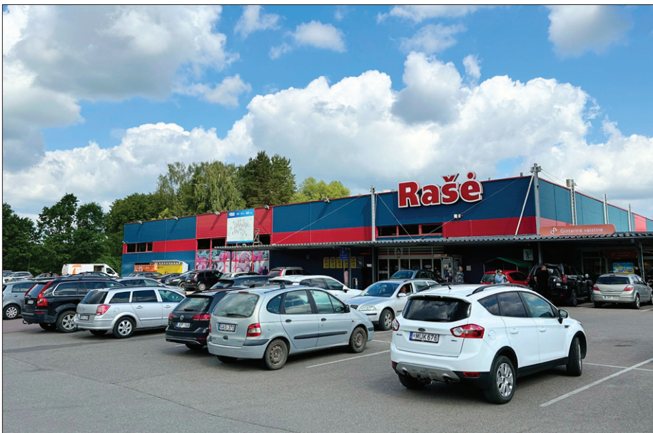
Prekybos centras „Rašė“ pastatytas 2001 m. Tai pirmasis tokio dydžio ir formato prekybos centras ne didžiuosiuose Lietuvos miestuose

Konkurencija didėja, gyventojų mažėja, todėl sudėtinga pajamas padidinti. Bet stengiamės išlikti konkurencingi, išlaikyti pardavimus ir lig šiol mums sekėsi. Mūsų privalumas – išskirtinis asortimentas. Stengiamės į savo parduotuves pritraukti smulkiuosius vietas ir Lietuvos gamintojus. Ieškome jų parodose, mugėse, turguose. Kartais gamintojai mus suranda patys. Taip galime pasiūlyti išskirtinių produktų – naminės dešros, duonos, konditerijos. Žuvį, silkes vežame net iš pajūrio. Smulkieji gamintojai dėl savo nedidelių apimčių, logistikos problemų ne visada gali papulti į