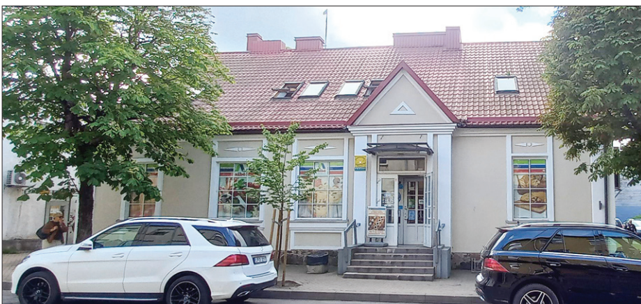
UAB „Utenos prekyba“ parduotuvė Anykščiuose, Vilniaus g. 3

liepos šeštadienis yra Tarptautinė kooperacijos diena. Nors šiandien esame uždaroji akcinė bendrovė, mūsų šaknys yra kooperatyvas. Miestiečiams Utenos miesto šventės proga dovanosime Marijono Mikutavičiaus koncertą, o buvusius ir esamus darbuotojus pakviesime švęsti į Burbiškio dvarą. Šventei ruošėmės