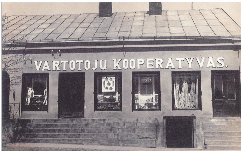
UAB „Utenos prekyba“ šaknys – Vartotojų kooperatyvas, 1924–1939 m. veikęs Utenio aikštėje

1940 m. okupavus Lietuvą prasidėjo Lietuvos ūkio pertvarkymas socialistiniais pagrindais, kuris palietė ir kooperaciją. Kooperatyvai ir jų sąjungos buvo nacionalizuoti ir privalėjo dirbti pagal Sovietų Sąjungoje veikusius pavyzdžius, kuomet kooperacija turėjo būti vienintele prekybos organizacija apskričių miestuose, miesteliuose ir kaimuose. Buvo įkurti nauji kooperatyvai Skiemonyse, Daugailiuose, Kuktiškėse, Tauragnuose, Užpaliuose, Skudutiškyje, taip pat atgaivinta veikla Debeikiuose ir Vyžuonose. Karo metų dokumentai nėra išlikę, bet kooperatyvų veikla karo metais buvo sudėtinga, daug turto buvo išgrobstyta, kooperatyvai sunyko. Po karo buvo atkuriamos prieš karą veikusios veiklos struktūros, tačiau dėl prekių stygiaus, menkos perkamosios galios ir kitų to meto trūkumų prekių apyvarta buvo maža, kooperatyvai dirbo nuostolingai. Tačiau jau 1945 m. Utenos kooperatyvų veikla tapo pelninga, buvo vykdoma plėtra, kurią vėliau 1947–1950 m. sustabdė administracinio teritorinio padalijimo pokyčiai. Vykdamas pokyčius buvo optimizuojami Utenos apskrityje veikę kooperatyvai juos stambinant: liko Utenos, Vyžuonų, Kuktiškių ir Tauragnų. Pokario metais pavyko išvengti didesnių trūkumų ir išievojimų. Prieš Utenos apskritį pertvarkant į rajoną, 1949 m. pabaigoje Utenos kooperatyvuose buvo 36 parduotuvės, parduotuvėlės, kioskai bei 1948 m. Utenoje pastatyta Universalinė parduotuvė, taip pat 7 stambesnės kaimo parduotuvėlės, 13 maitinimo įmonių. Po