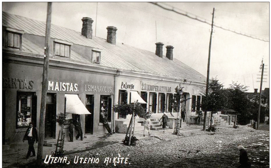
Žemės ūkio kooperatyvas, veikęs tarpukariu

„Lietūkis“ šaltiniuose Utenos žemės ūkio draugija pirmą kartą paminėta 1924 m., t.y. praėjus metams po „Lietūkio“ įsteigimo. Tikslėnių duomenų apie draugijos įsteigimą archyvuose nerasta, todėl šie metai laikytini kooperatyvų kūrimosi Utenos apskrityje pradžia. Šios draugijos visuotinio narių susirinkimo nutarimu 1931 m. įkurtas Utenos žemės ūkio kooperatyvas su 84