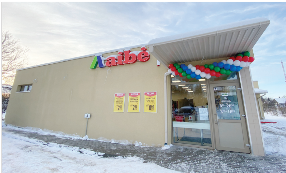
Viešintų parduotuvės atidarymas 2021 m.

Įmonės šimtmetį švęsime Valstybės dieną – liepos 6-ąją. Kartu tai bus ir profesinė mūsų diena, nes pirmasis